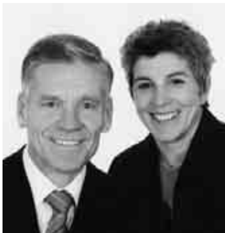
Президент и сестра Рот.