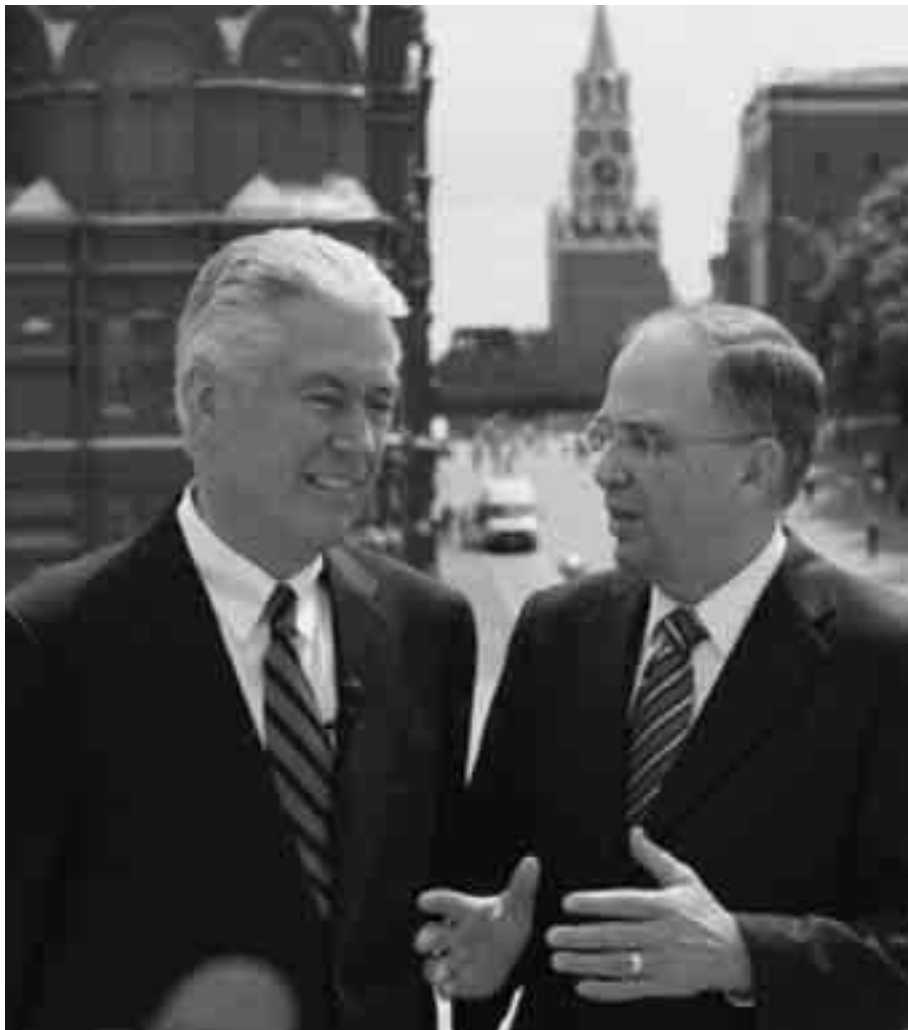
Президент Ухтдорф и старейшина Андерсън в Москва край Червения площад.

мисионерска конференция. На другия ден се проведе обучение на свещеническите ръководители, в което участваха братя от Москва, Санкт-Петербург, Самара, Ростов, Киев, Рига, Донецк и Днепропетровск.