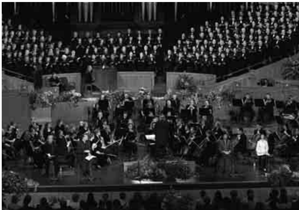
Оркестърът на Храмовия площад, показан тук да свири с Хора на Табернакъл, през 2009 г. отбелязва своята 10-годишнина.

екстазът на надеждата и изключително силните духовни връзки”. ■