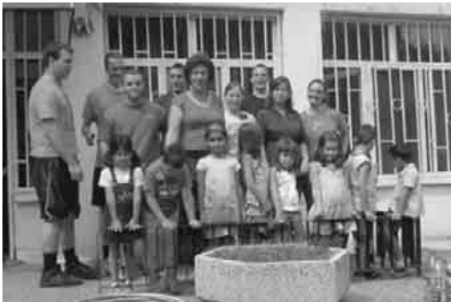
Мисионери с децата от градината.