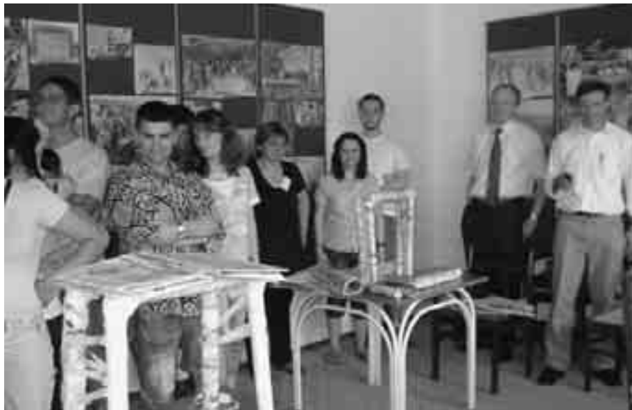
Състезанието за строителство на най-здрав хартиен мост.

скоч-лента. Мостът трябваше да издържи кутия, тежаща 35 паунда, и да бъде достатъчно висок, за да може кутията да мине под него. Пет от осемте моста издържаха на изпитанието.