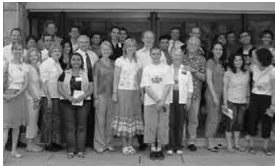
Снимка за спомен след конференциите.

Старейшина Сенканс инициира състезание между няколко отбора, които трябваше да направят мост, използвайки само вестници и