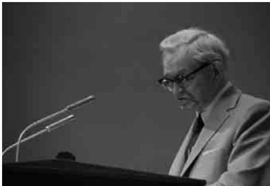
Този месец преди 50 г. президент Дейвид О. Макей насърчи всеки член да бъде мисионер.