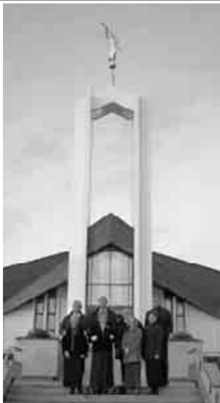
Снимка за спомен от храма.

бъдат пълномощници за някои от тези предци.