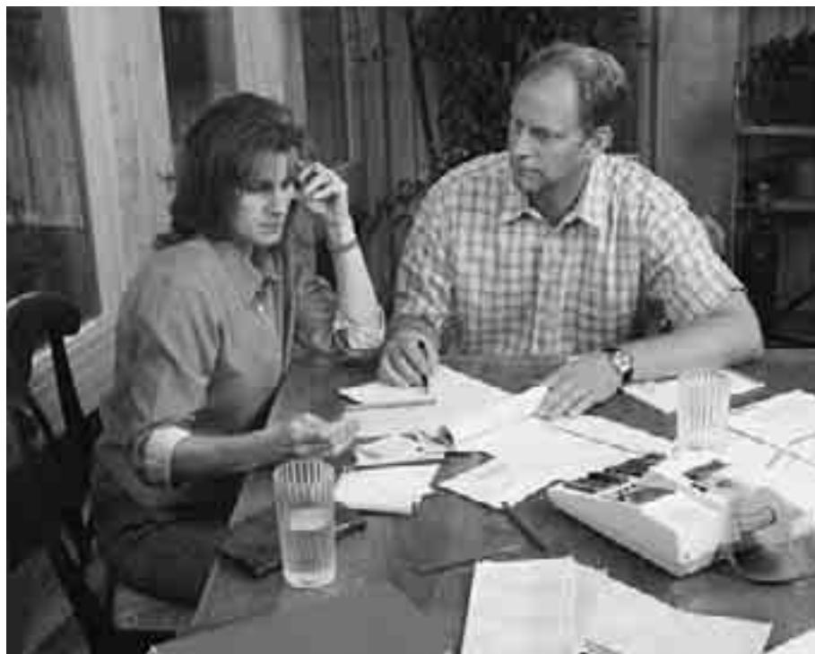
Животът според Господния финансов план изисква търпение, умереност, жертва и подчинение.