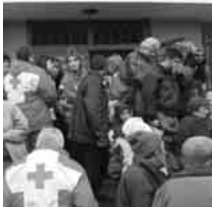
Представители на Червения кръст разпределят даренията за жителите на с. Дълго поле.