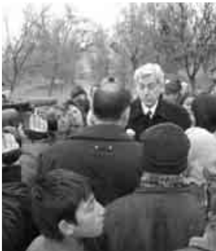
Момент от церемонията по предаването.

На 24 ноември в село Дълго поле близо до Пловдив се състоя скромна церемония по предаване на дарение, като помощите бяха разпределени от доброволци на БЧК – индивидуални хуманитарни пакети с храна, одеала, постелни принадлежности, легла, чаршафи, дезинфектанти за най-пострадалите семейства, които от рано сутринта се бяха събрали на площада