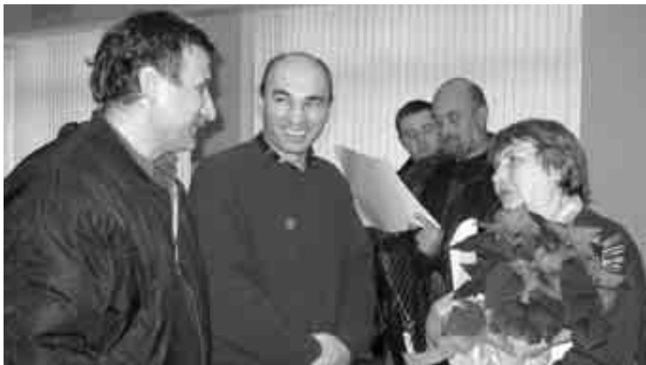
Гости и членове искат автографи от любимата си актриса.

WE ARE WAITING ON THE PHOTO FOR THIS MISSIONARY... WE HAVE NOT RECEIVED IT YET.