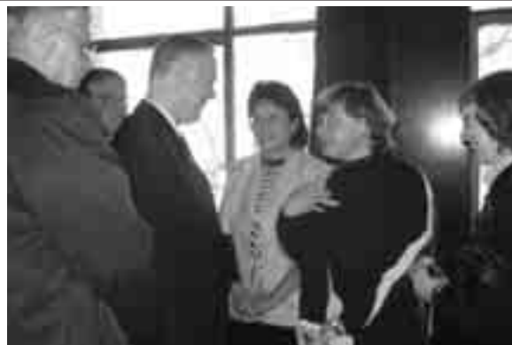
Президент Нюншундър говори на членовете.

В своята реч президент Нюншундър каза, „Вярвам в събирането на Израил и че всяка конференция е едно събиране на Израил. Същността на Евангелието е Единението на Исус Христос. Това сме го знаели и преди да се родим, чуваме го често и сега. Обичам да сме заедно на конференциите. Това е като семейно събиране. Слушаме, за да получим съвет и