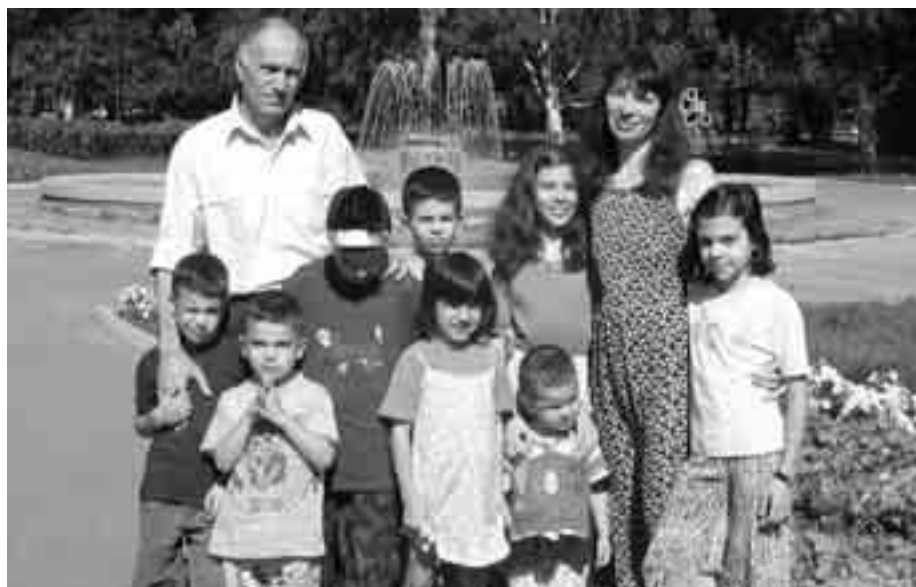
Сем. Хамзе с техните деца.

„Социалните служби и държавните институции у нас са равнодушни към проблемите на многодетните семейства, а би трябвало да мислят в перспектива, да имат демографска