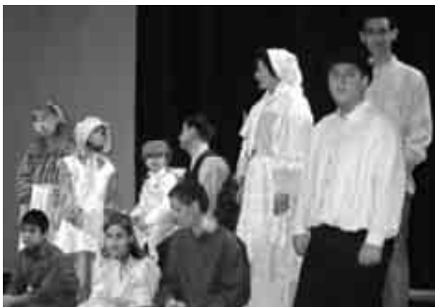
Сцена от театралната постановка.

Като фон на кръглата сцена зрителите гледаха „живи картини“, свързани с ключови моменти от живота и делото на Джозеф Смит, представени от членове на Църквата и мисионери. Те бяха облечени в специални костюми, каквито са носили