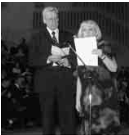
Президент и сестра Джонсън представят програмата на честването.

Радостта от очакването на светлия празник витаеше във въздуха и правеше атмосферата още по-специална и вълнуваща. Хората разгръщаха с интерес новата брошура за дейността на Църквата в България, която виждаха за пръв път.