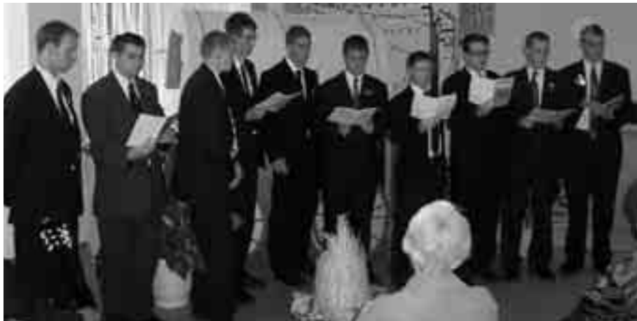
Хорът на мисионерите по време на изпълнение.

юли 1844 г. разярена тълпа убива Пророка Джозеф Смит.